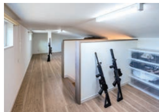
季節物や趣味のグッズをしまおうにびったりの口フトと玄関土間。収納の豊富さも魅力の一つ。