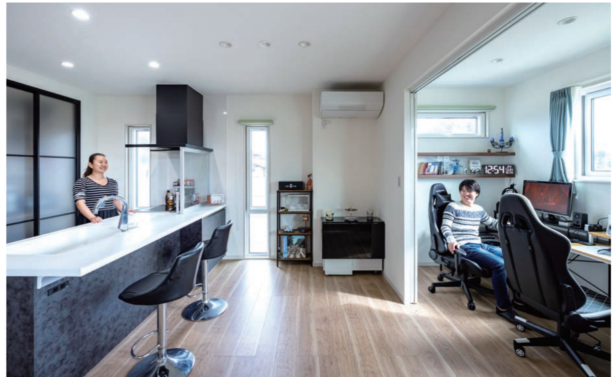
LDKの一角に設けられたのが、ご夫婦のための要望に応えた専用のゲーム部屋。たくさんの設備機器が並び、いつでも気兼ねなく楽しめる理想的な環境をカタチに。さらに引きずり仕切れるよう工夫しており、どちらかがリビングでテレビを見たときなどに音漏れが防げるだけでなく、急な来客時に空間を隠すこともできる。