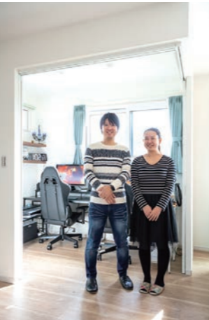
満足そうな笑みを浮かべるHさんご夫婦。沢山のこだわりが詰まった住まいに、喜びもひとしお。