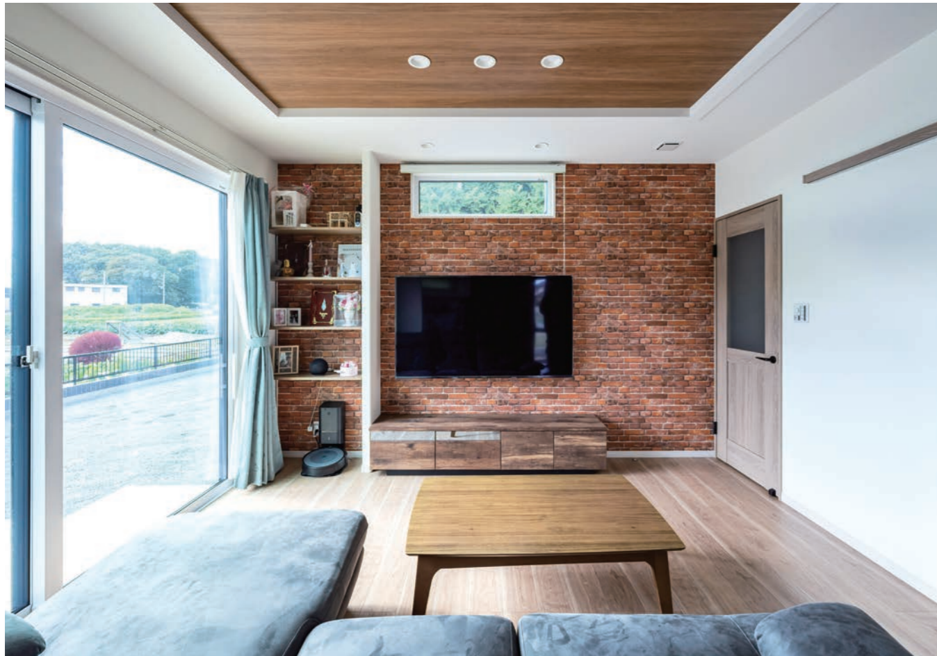
白い壁や床・天井の木目柄などナチュラル基調としたリビングの中で、ひととき異彩を放つのが「凹凸感のある壁紙を使いたかった」(奥様)というメインウォールのレンガ柄。客人も玄関から足を踏み入れた瞬間に、思わず目を奪われるだろう。お気に入りのキャラクターや思い出の写真がディスプレイできるよう飾り棚を設置したほか、高窓の先に色鮮やかな樹木が覗く。(この見開き頁の写真はH氏邸)