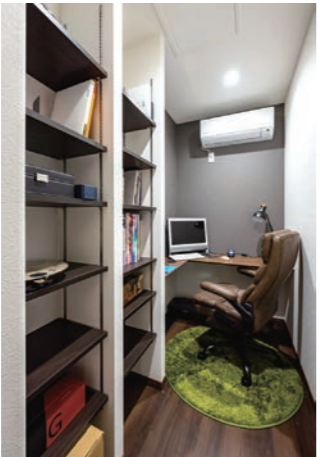
ご主人の「こもり部屋」となる書斎。漫画喫茶のようなコンパクトさが逆に心地いいと好評だ。