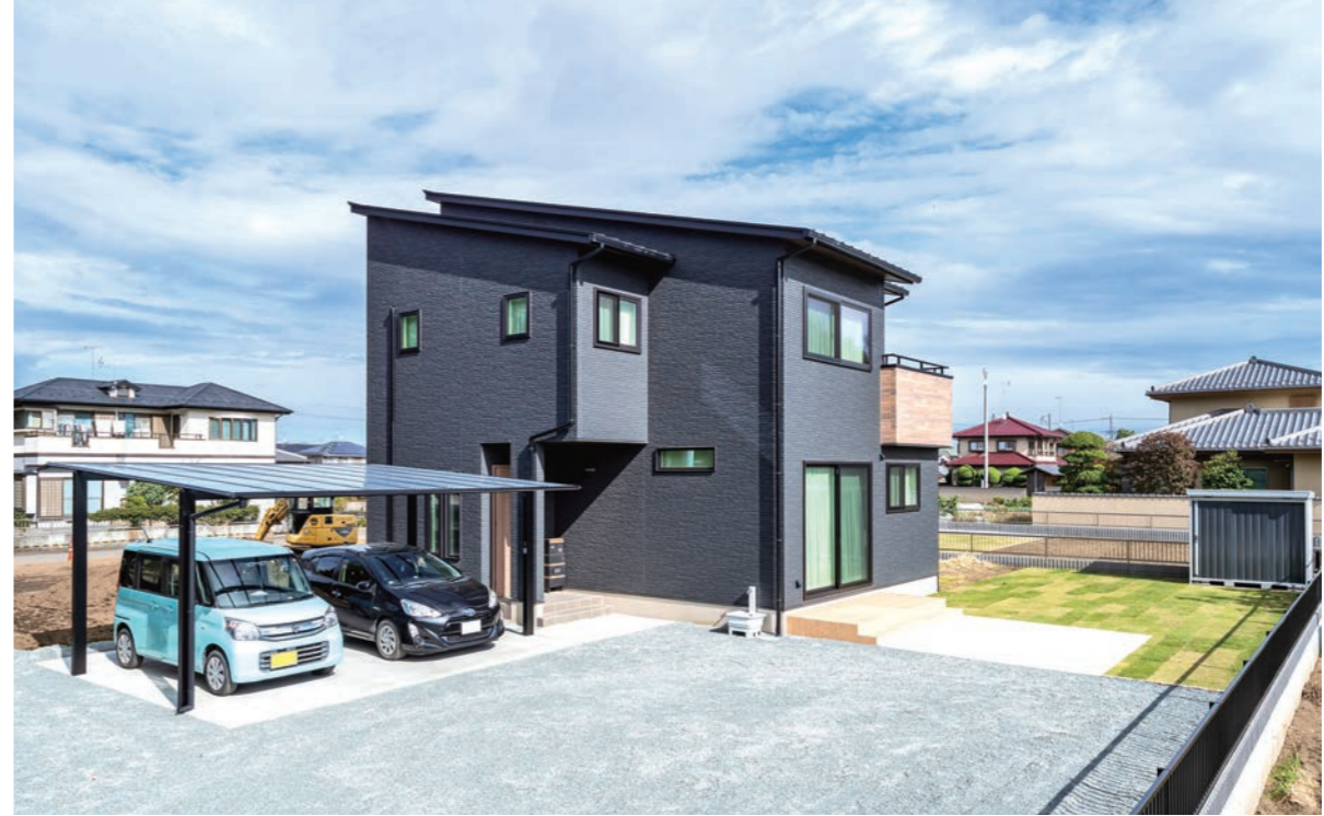
120坪というゆとりある敷地に建つ外観は、3階建てかと間違われるほどのボリュームを誇る。テラスの先にはコンクリートを打っており、「バーベキューのときに万が一、火が飛んでも燃える心配がありません。それに大きな荷物を運びたいときに直接、車をリビングの目の前に止められる点も便利です」と話すご主人。