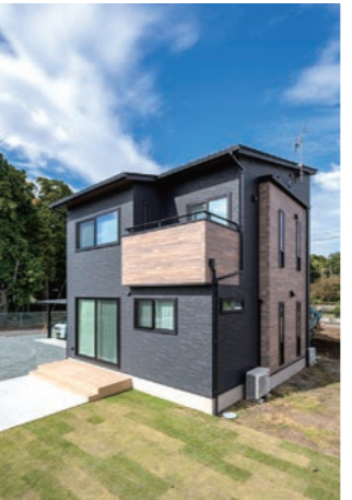
外壁はモダンな黒がベースだが、バルコニーなど一部にアクセントとして木目柄を採用している。