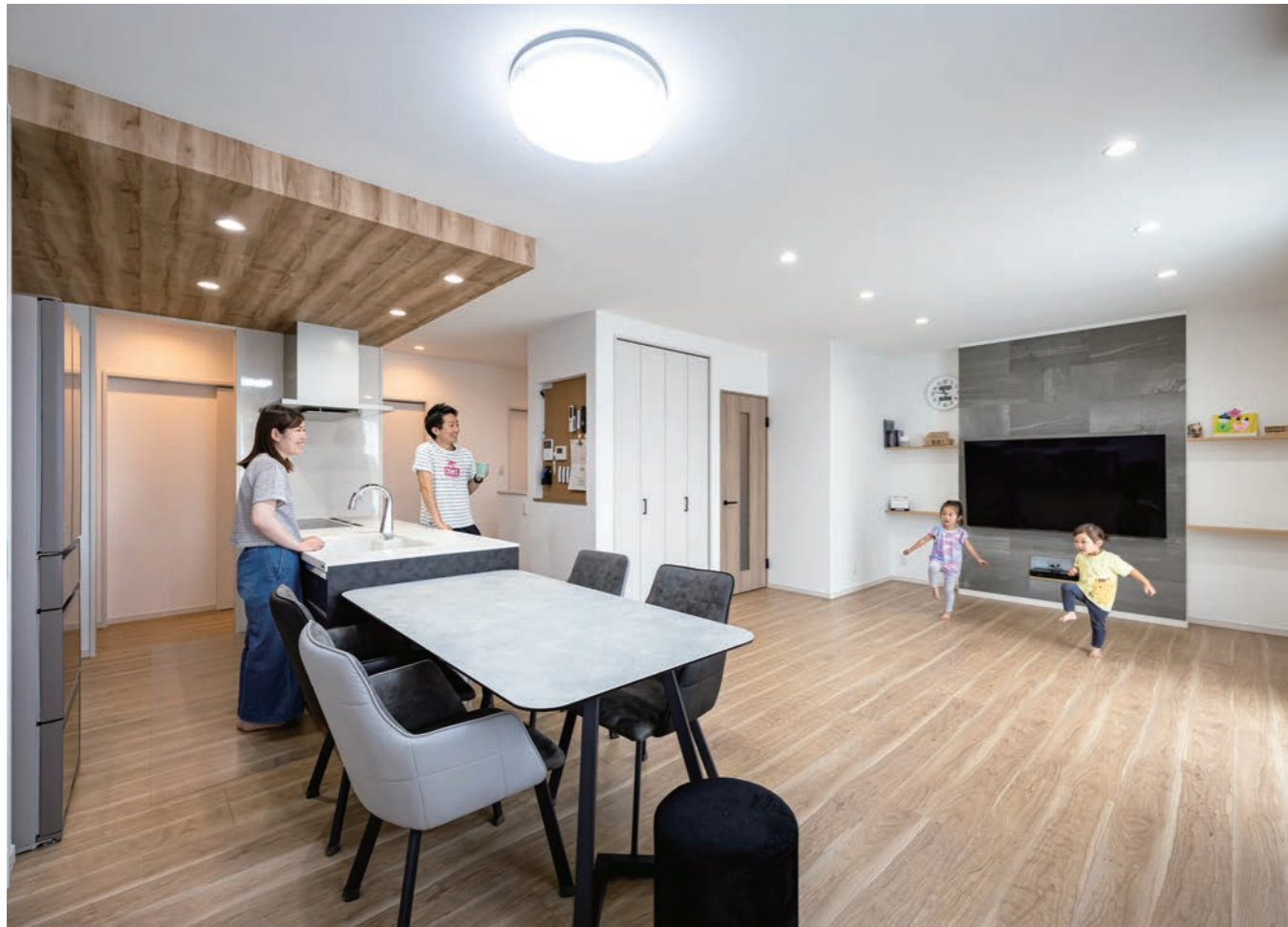
メインウォールに用いたのは、調湿効果を備えた石張り調タイルの「エコカラット」。左右の飾り棚に加え、TVボードを置かず済むようレコーダー専用のニッチも設置。「掃除がラクだし、子どもたちが棚をいじってしまう心配もありません」と奥様。カレンダーや書類、そしてリモコンまで貼ったキッチン対面のマグネット仕様のコルクボードはSNSから得たアイデア。(この見開き頁の写真はM氏邸)