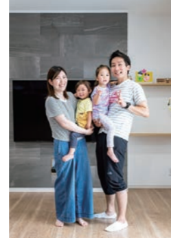
※太田市・Mさんご家族