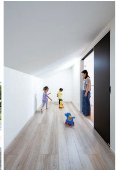
メインカラーは重厚な黒。汚れが目立ちにくく、よりモダンさを強調すべくサッシや雨樋も同色で統一。東側の玄関周りのみアクセントとして木目柄をミックスしたほか、大きな片屋根のインパクトが増す南側は平屋かと思わせるほど表情が変わる。急勾配を活かして実現した2階のロフトは収納やキッズスペースとして活躍。