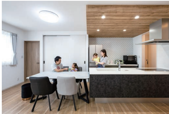
同社が提携するパナソニック製品の中からチョイスした、高いデザイン性と収納力を兼ね備えたフラットなオープンキッチン。ダイニングテーブルとチェアが調和したコーディネートも魅力。